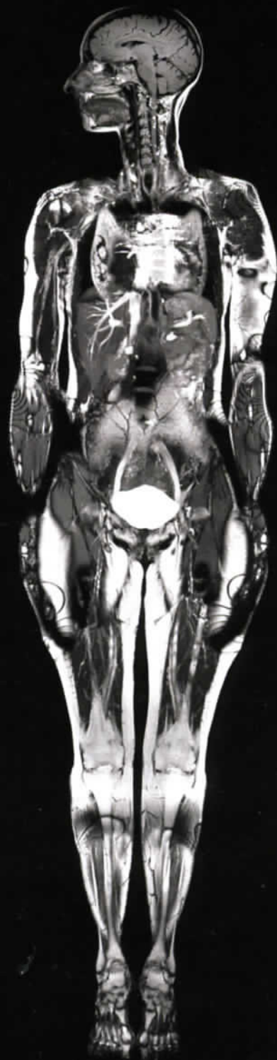
© CHANTAL GERVAIS Autoportrait 3 - 2008 Impression à jet d'encre sur polypropylène 207 x 103 cm